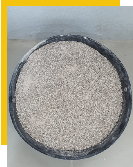
Powder 3 mm