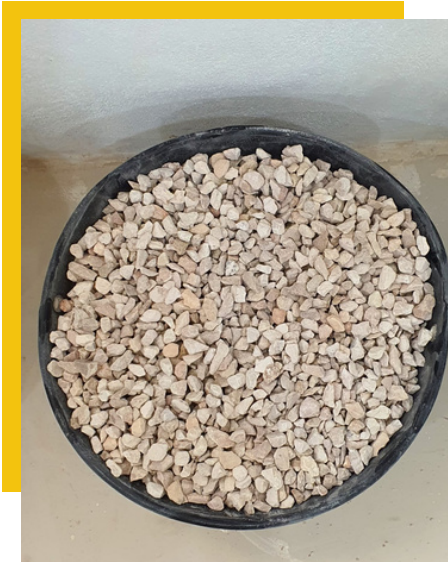
3/8 inch ، بوصة ٣/٨