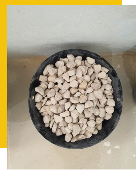
1 inch ، بوصة ١