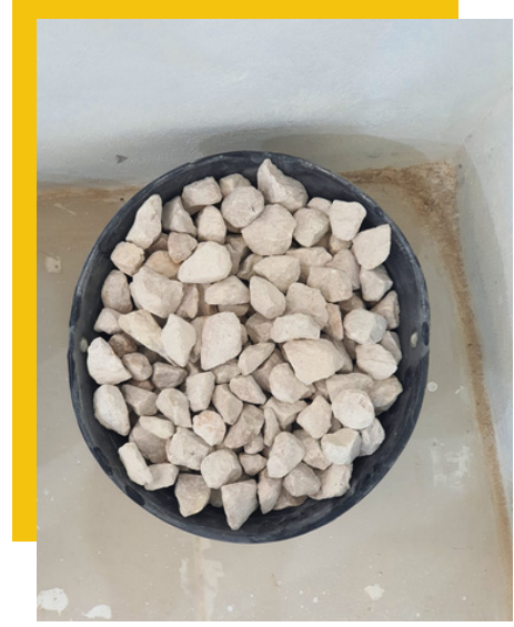
1 1/2 inch ، بوصة ١ ١/٢