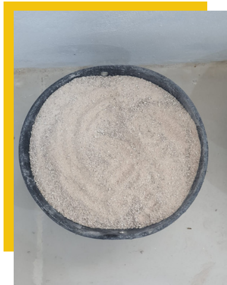
Powder 1.5 mm