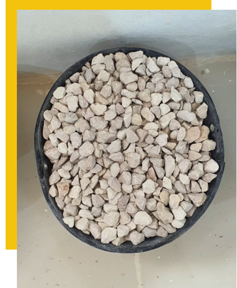
3/4 inch ، بوصة ٣/٤