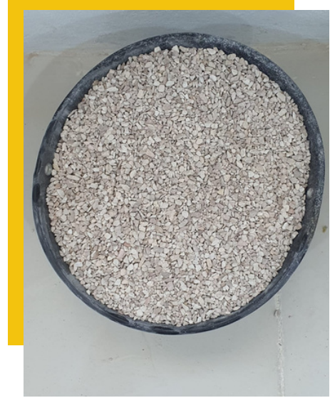
3/16 inch ، ٣/١٦ بوصة